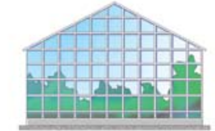
*CO 2 ZENGİNLEŞTİRME UYGULAMASI SERA