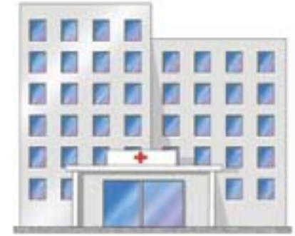
CHP UYGULAMASI, HASTANE

© 2007 ExxonMobil Corporation Mobil ve ExxonMobil logoları, Mobil Pegasus, Mobil SHC, Mobil Rarus, Mobil Glygoyle ve Pegasus tasarımı ExxonMobil Corporation'ın veya bağlı kuruluşlarından birinin ticari markalarıdır. Bu belgede ExxonMobil terimi sadece okuma kolaylığı sağlamak için kullanılmıştır ve ExxonMobil Corporation ya da bağlı şirketleriyle ilgili olabilir. Bu belgedeki hiçbir şey yerel kişilerin şirket ayrıntılarını geçersiz kılmak amacıyla değildir.